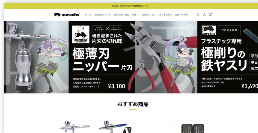
aurochs (株式会社aurochs 様) https://aurochs.co.jp/

商品一覧ページには検索アプリを利用し、ユーザーが商品を探しやすくカスタマイズしています。特定の商品は、定期購入商品も販売できるようにカスタマイズしました。